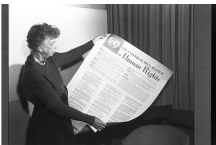
YK:n yleismaailmallinen ihmisoikeuksien julistus 10.12.1948

Kuka on Maitreya? Maitreya on Henkisen Hierarkian johtossa olevan Maailmanopettajan henkilökohtainen nimi. Uskontokunnassa riippuen Maitreya tunnetaan myös Kristuksen, Buddhan, Krishnan, Innam Mahdin tai Messiaan nimillä. Tästä infokortista löydät lisää Maitreya ja Henkisen Hierarkian jäsenille heidän todellisen luonteensa henkisinä olentoina, avustajakseen meitä ja johtajakseen meitä. Vesi miehen alkuaan. on laajalti tunnettu esoterisissä piireissä, mutta sitä ei monistakaan syistä ammeta vielä julkisuuteen. Yhdessä Maailmanopettaja ja Henkisen Hierarkian ovat tulossa kaipaamaan julkisuuteen osoitukseksi ihmiskunnan jäsenille heidän todellisen luonteensa henkisinä olentoina, avustajakseen meitä ja johtajakseen meitä. Vesi miehen alkuaan.